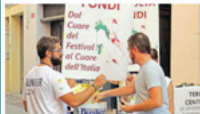
Tam-tam solidale nel carcere dell'Arginone. A sinistra: il Grande Cappello al Ferrara Buskers Festival che ha donato il ricavato ai terremotati del Centro Italia.

Una decisione spontanea da parte delle persone rinchiusi all'Arginone Anche i Buskers si confermano generosi, donati i ricavi del Grande Cappello